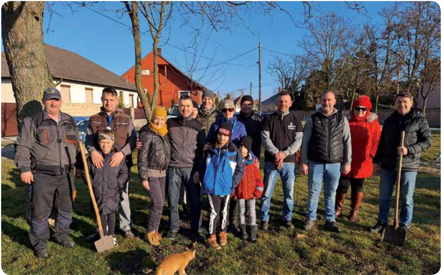
Jánossomorja is csatlakozott a Nemzeti Faültetés Napja országos felhíváshoz. A lelkes önkéntesekből álló csapat 24 fát ültetett közterületekre, ebből hét Hanságligetre került.