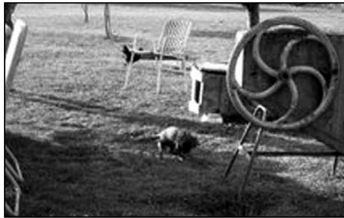
Két hónapos kiskutya láncon

ta szilveszter napján hajnalban talált elütve az úttesten. Járműve nem lévén, úgy vonszolta haza, és értesítette a Menedék Állatvédő Alapítványt. Szerencsére a kutyus orvosi ellátásának, illetve későbbi műtétjének a költségeit egy külföldi állatvédő szervezet finanszírozta. De itt említeném annak a beagle kutyusnak az esetét is, akit ez év elején ütött el autójával az egyik jánossomorjai la-