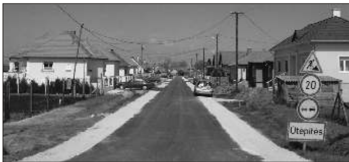
A Dr. Dicsőfi és a Csalogány utca 2005 tavaszán Kapott új aszfaltburkolatot

zebb az országban. Vagy értékelhetjük úgy is, hogy jó volt kihasználni a lehetőségeket, és örülünk az eddigi eredményeknek?