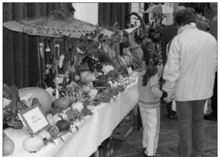
Különböző kertészeti termékeket állítottak ki a nagyteremben