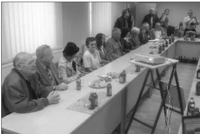
Az illingeniek először előadásán ismerkedtek a várossal

A németországi Illingenből huszonöt fős vendégszolgálat érkezett október 11-én, csütörtökön az esti órákban Jánossomorjára, hogy megismerkedjenek a helyi civil szervezetekkel. A Stuttgarthoz közeli német település ugyanis városunkkal szeretne partnerkapcsolatot kialakítani.