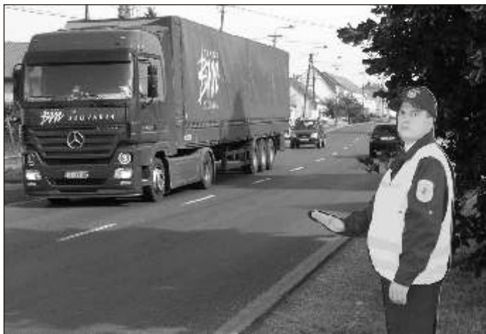
A „bádogrend” is jól ismerik már a sofőrök, már nincs sebességcsökkentő hatásuk

Nem érznek forgalomcsökkenést a 86-os út mellett élők az útdíj bevezetése óta. A kamionok továbbra is sokan vannak, és nagy sebességgel hajtanak keresztül a városon, nem kis veszélyforrást jelentve a Rákóczi úton lévő Klafszky-iskola diákjaira és az óvodásokra sem.