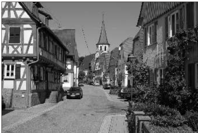
Illingen történelmi központja

Egy öttagú önkormányzati delegáció látogatott el az elmúlt hónap végén Illingenbe. Ezt megelőzően még áprilisban kereste meg a Győr-Ménfőcsanak-Sopron megyei közgyűlés hivatala önkormányzatunkat, hogy egy hasonló adottságokkal rendelkező németországi nagyközség magyarországi partnertelepülést keres. Így amikor május elején a hattagú illingeni küldöttség ellátogatott megyénkbe, négy község mellett Kapuvár és Jánossomorja városokat is felkeresték. Végül a látottak alapján úgy határoztak, Jánossomorjával kívánnak partneri kapcsolatot létesíteni, így viszontlátogatásra hívtak meg bennünket.