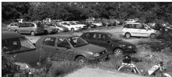
Ez már csak a múlt. Júniusban még tömegével álltak az autók a határátkel melletti parkolóban

dott fel, akkor is csak percekre. Az osztrák oldalon posztoló magyar és ausztriai határ rök itt-ott kedélyesen mosolyogva, ismer sként köszöntötték az áthaladók javát az útlevél-, és igazolvány-ellen rzések során. Tehették, hiszen f ként a már eddig is erre járó jánossomorjai munkába indulók érkeztek az átkel höz. Olyanok, akik eddig