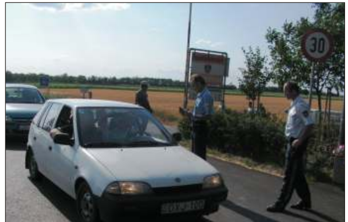
A július 2-án megnyílt kishatárt a 30 kilométeres körzetben élők használhatják, így szükséges a lakcímkijelölés is

Július 2-án, hétfőn megnyílt a Jánossomorja és Andau közötti határátkelés autósforgalom számára is. A kishatárt a 30 kilométeres körzetben élők használhatják 3,5 tonnánál kisebb járművekkel, naponta 6-tól 22 óráig.