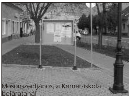
Mosonszentjános, a Karner-iskola bejáratánál