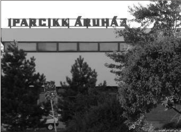
Mára már csak a felirat maradt...