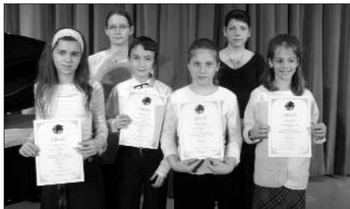
A zongoraversenyen eredményesen szereplő tanulók

Zeneiskolánknak idén ismét lehetősége nyílt arra, hogy tanítványait megmérettesse egy olyan versenyen, ahol több mint 100 növendékeivel együtt léphet színpadra a neves zsűri előtt.