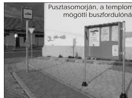
Pusztasomorján, a templom mögötti buszfordulónál

A közelmúltban esztétikus hirdető táblákat helyeztek ki az önkormányzat a három városrész központjaiban. Az itt ki függesztett hirdetőanyagok segítségével folyamatosan tájékozódhatnak az önkormányzat aktuális közleményeiről és egyéb közérdeklődő információkról. E mellett a m. vel. dési ház aktuális programjairól is értesülhetnek azok, akik rendszeresen felkeresik ezeket a hirdető táblákat.