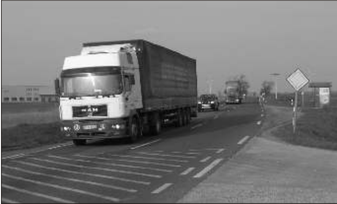
Április 1-jétől fizetősé vált a 86-os f út Jánossomorja és Mosonmagyaróvár közti szakasza D4 kategóriájú gépjárműveknek

A miniszteri aláírással immár véglegessé vált: a 86-os f út Mosonmagyaróvár és Jánossomorja közti szakasza is fizetősé válik április elsejétől a 12 tonnánál nagyobb teherautók számára. Ettől a forgalom mérséklését várják a tárcánál az adott utakon. Felmerült, január elsejétől a 12 tonna alatti teherautóknak is fizetniük kell majd.