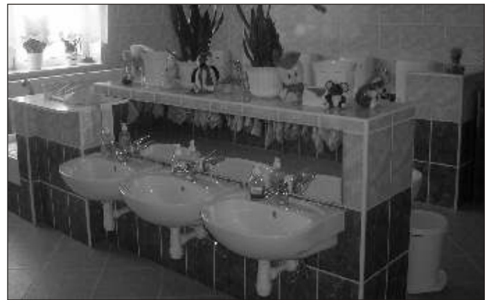
Teljesen felújították a mosdókat a bölcs dében