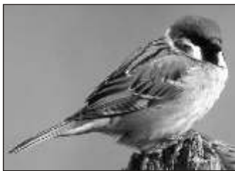
Folytatás a 15. oldalról:

Nyáron a határban él, bokrokon, odúkban van a fészke. Télen beköltöznek a településekre, és nagyobb csapatokba verednek. Ezek szoktak megjeleni a téli etetőkön, és min-