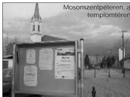
Mosonszentpéteren, a templomtérén