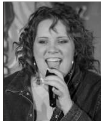
Tóth Vera a Megasztárból